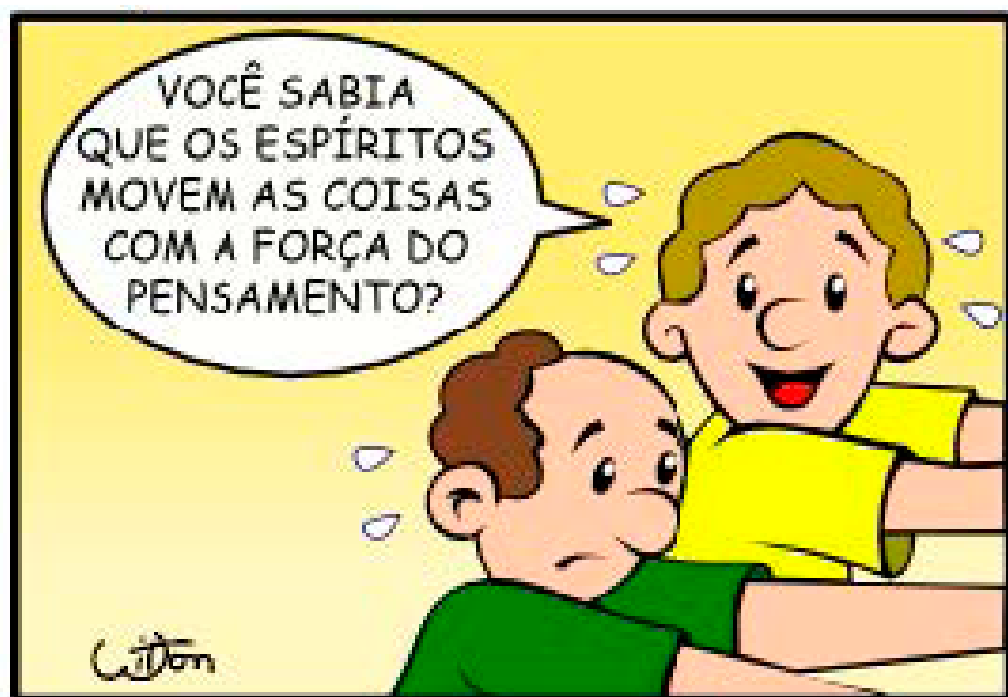
103 - FORÇA DO PENSAMENTO