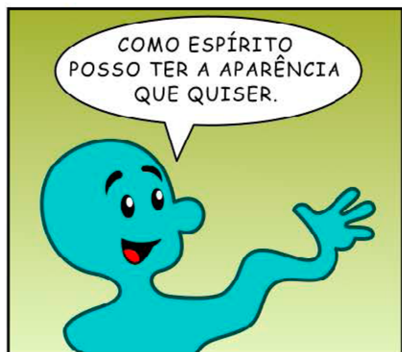
410 - MANIFESTAÇÕES ESPÍRITAS (L.M.)