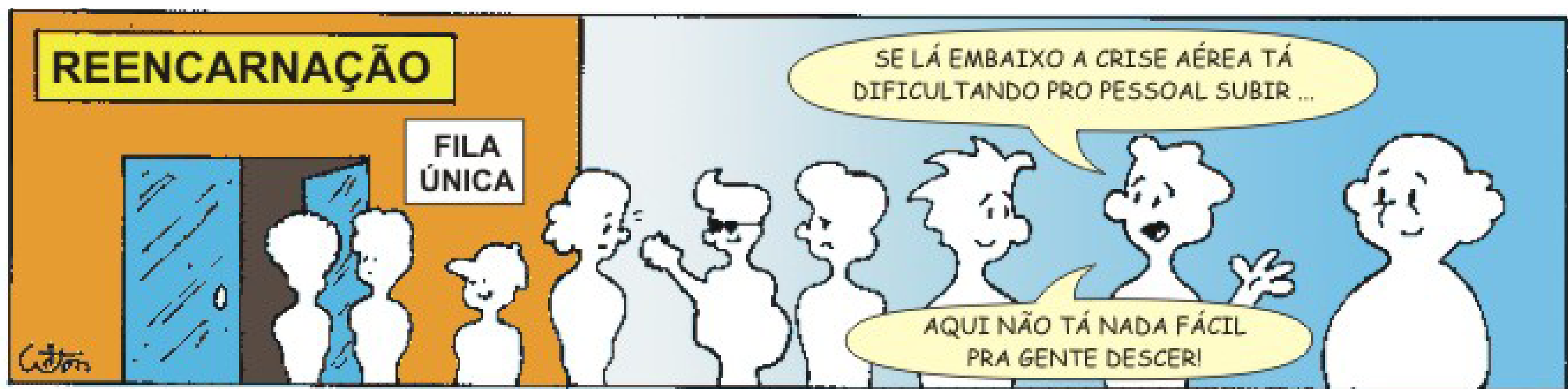
33 - A Fila