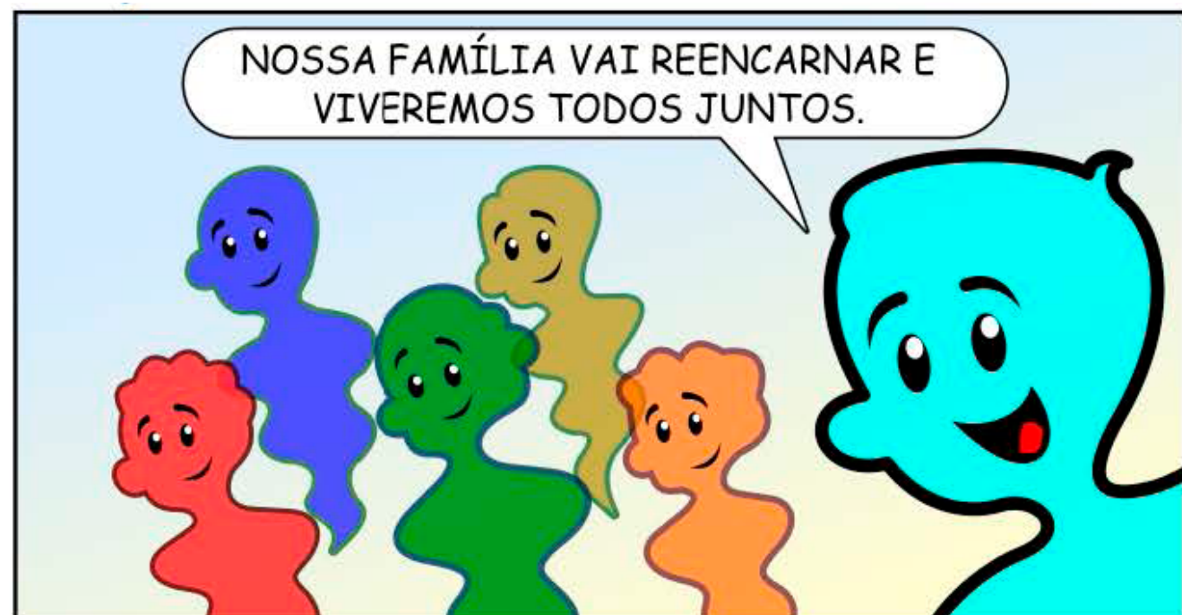
236 - SELFIES