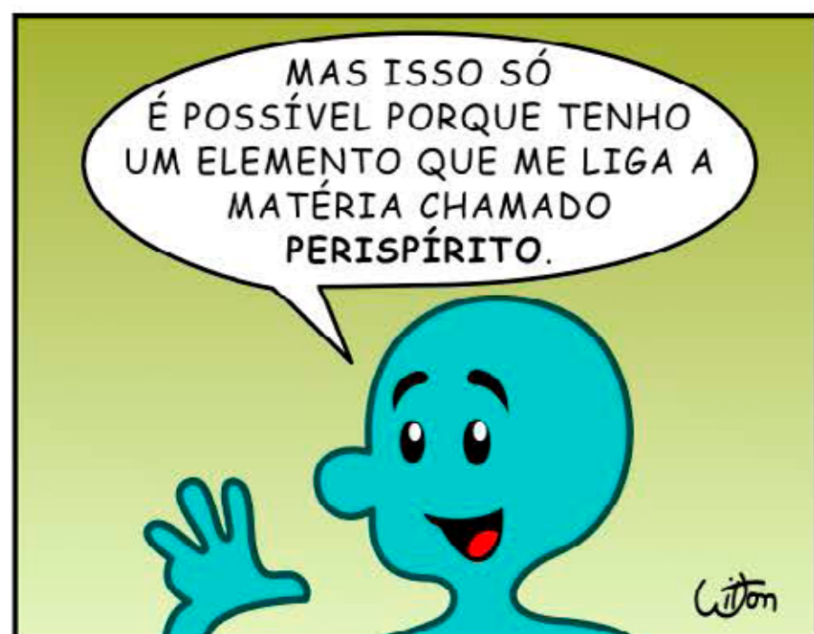
(L.M. = Livro dos Médiuns)