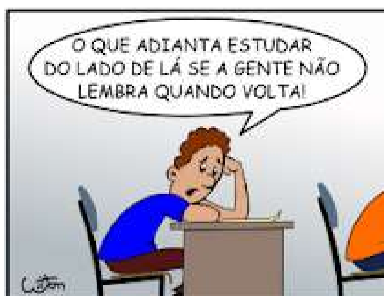
415 - Promessa de ano novo