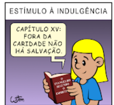
398 - CONCLUSÃO - VII (C)