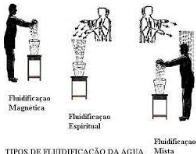
TIPOS DE FLUIDIFICAÇÃO DA ÁGUA

Para cada paciente o fluido medicamentoso será específico não só para a sua enfermidade física, mas também para as necessidades espirituais de cada um. Deve ser usada como um medicamento. Manda o bom senso que não se utilize remédios sem necessidade, portanto, da mesma maneira, só deve usar a água fluidificada quem de fato estiver necessitando dela. Tudo em excesso faz mal, não é mesmo.