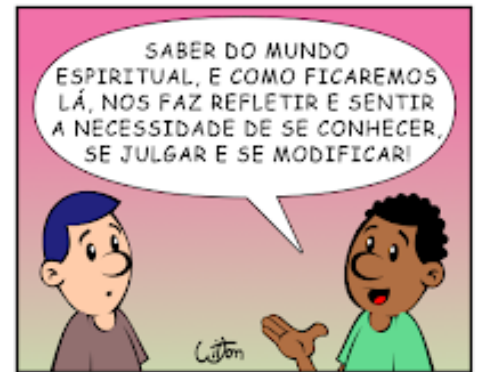
399 - CONCLUSÃO VIII

QUANTO AOS EFEITOS QUE O ESPIRITISMO PRODUZ: