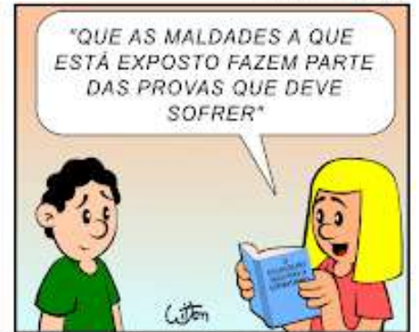
O Evangelho Segundo o Espiritismo, capítulo 12, item 4