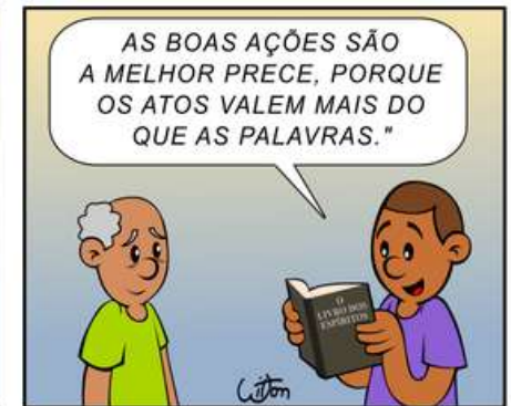
*O Livro dos Espíritos, pergunta nº 661