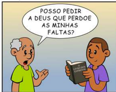
384 - L.E.* RESPONDE: PRECE