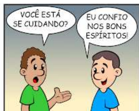
298 - SUA PARTE