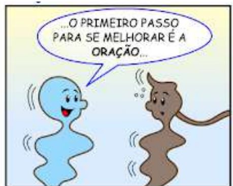
248 - ORAÇÃO