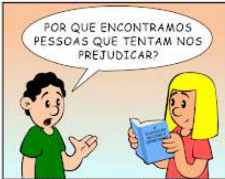
383 - O Evangelho responde: Perdão