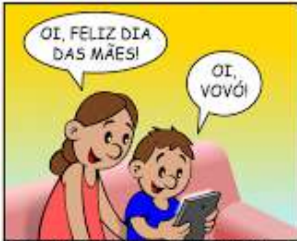
306 - DIA DAS MÃES - QUARENTENA