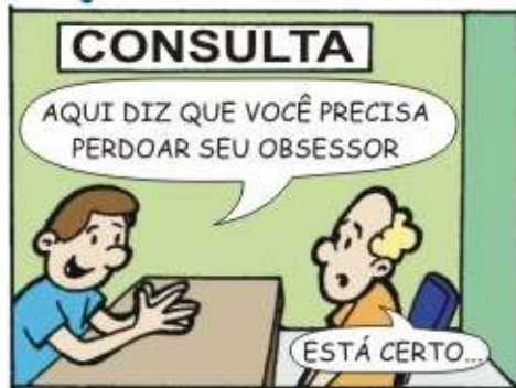
33 - Reforma Íntima